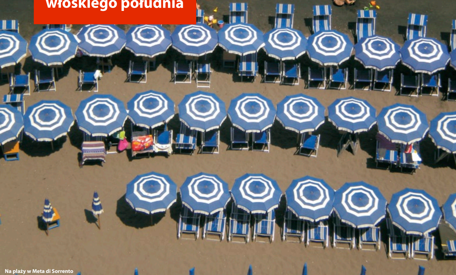
Na plaży w Meta di Sorrento