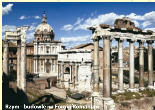
Rzym - budowle na Forum Romanum

Dzień 5: Śniadanie, przejazd do starożytnego miasta w POMPEJACH – wstęp na teren Muzeum Archeologicznego