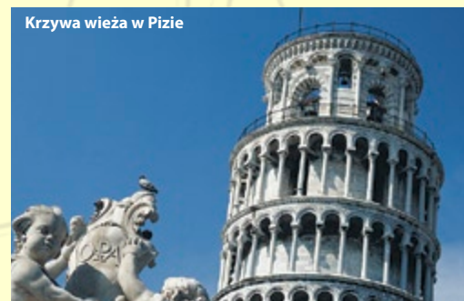
Krzywa wieża w Pizie

5 dzień: Przejazd przez Austrię i Czechy, przyjazd do Polski w godzinach popołudniowych.