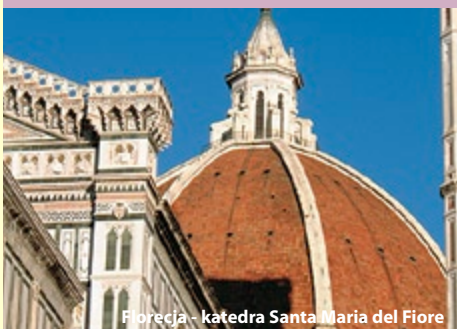
Florence - katedra Santa Maria del Fiore

usług lokalnych przewodników, biletów wstępu do zwiedzanych obiektów, biletów komunikacji miejskiej (orientacyjny koszt uczestnictwa w całym programie ok. 65 €), napoi do obiadowej, dopłat do połączeń antenowych, dopłaty do pokoju 1os. 160 PLN.