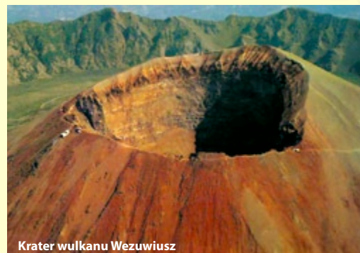
Krater wulkanu Wezuwiusz

Dzień 10: Przejazd przez Austrię, Czechy, przyjazd do Polski w godzinach południowych zgodnie z rozkładem jazdy.