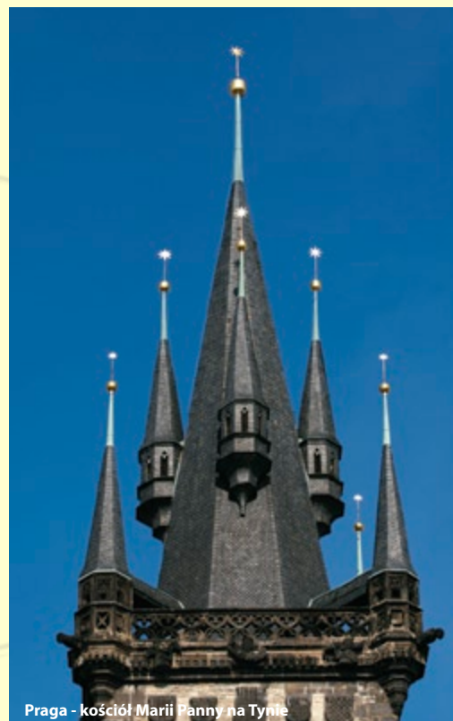
Praga - kościół Marii Panny na Týnie