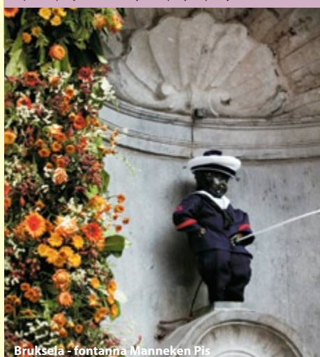
Bruksela - fontanna Manneken Pis

usług lokalnych przewodników, biletów wstępu do zwiedzanych obiektów, biletów komunikacji miejskiej (orientacyjny koszt uczestnictwa w całym programie ok. 65 €), napoi do obiadokolacji, dopłat do połączeń antenowych, dopłaty do pokoju 1os. 160 PLN.