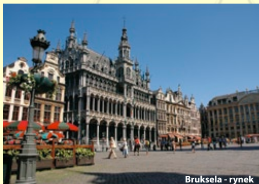
Bruksela - rynek

4 dzień: Śniadanie, wykwaterowanie z hotelu. Przejazd do AMSTERDAMU , zwiedzanie miasta: Plac Dam z Pałacem Królewskim, Stary Kościół, Jordaan - malownicza dzielnica