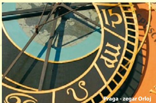
Praga - zegar Orloj

3 dzień: Śniadanie, przejazd do centrum PRAGI . Rejs statkiem po Wełtawie (2 godz.), czas wolny na starówce. Wyjazd w kierunku Polski, przyjazd na miejsce zbiórki w godzinach wieczornych.