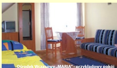
Ośrodek Wczasowy „MARIA” - przykładowy pokój