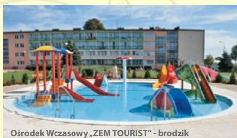
Ośrodek Wczasowy „ZEM TOURIST” - brodzik

PUSTKOWO – niewielka miejscowość nadmorska w zachodniej części wybrzeża, położona pomiędzy Pobierowem a Rewalem w sąsiedztwie Trzęsacza. Słynie z szerokiej, piaszczystej i spokojnej plaży, oddzielonej od lądu niewysokim klifem. Osobom aktywnym oferuje liczne ścieżki rowerowe, trasy spacerowe, możliwość korzystania z nowych obiektów sportowych.