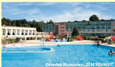
Ośrodek Wczasowy „ZEM TOURIST”