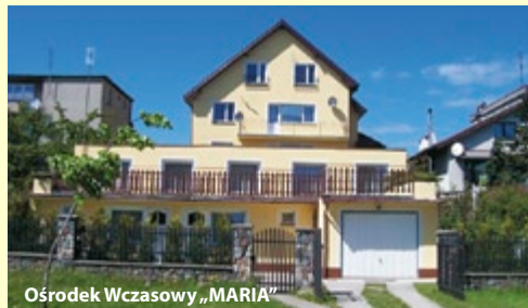
Ośrodek Wczasowy „MARIA”