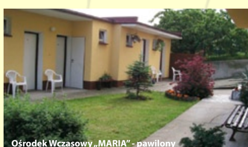
Ośrodek Wczasowy „MARIA” - pawilon

WŁADYSŁAWOWO – pretenduje do miana jednego z głównych wczasowisk na wybrzeżu. Klimat ma tutaj lecznicze właściwości, a powietrze nasycone jest jodem. Bogate walory przyrodnicze i turystyczne - słońce, szerokie, czyste plaże, morski klimat a także nadmorskie kafejki i pełne uroków życie nocne – sprawiają, że można tam spędzić atrakcyjny wypoczynek wakacyjny.