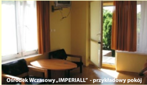
Ośrodek Wczasowy „IMPERIALL” - przykładowy pokój