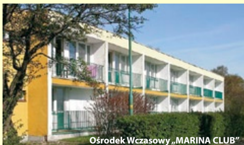
Ośrodek Wczasowy „MARINA CLUB”