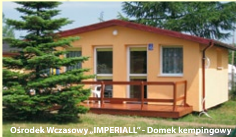
Ośrodek Wczasowy „IMPERIALL” - Domek kempingowy

3 posiłki dziennie (śniadanie, obiad, kolacja) – serwowane do stolika. Świadczenie rozpoczyna się kolacją, a kończy śniadaniem w ostatnim dniu.