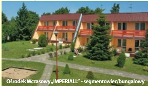
Ośrodek Wczasowy „IMPERIALL” - segmentowiec/bungalowy