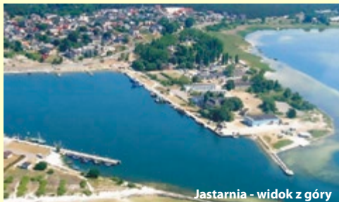
Jastarnia - widok z góry

3 x dziennie – śniadania, kolacje (w formie bufetu), obiad serwowany do stolika. Świadczenie rozpoczyna się kolacją w dniu przyjazdu, a kończy obiadem w ostatnim dniu.